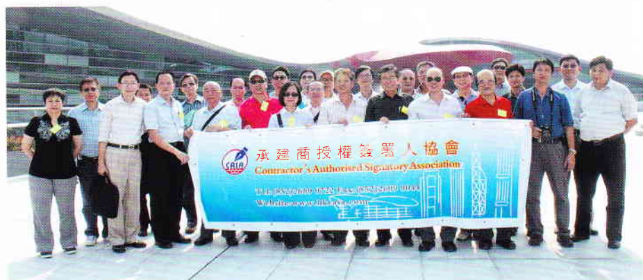
團友在番禺亞運城留影