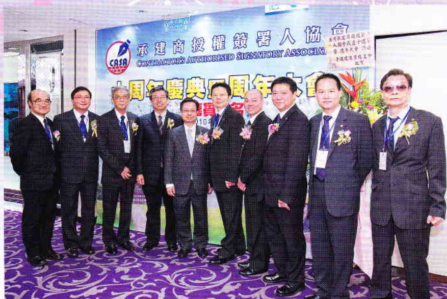
眾委員與區載佳署長留影