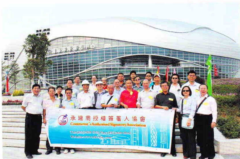
團友在蘿崗廣州國際體育演藝中心前留影