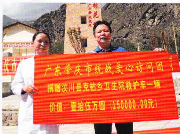
21/5/2010 以肇慶統戰部名義向汶川捐贈救護車一輛