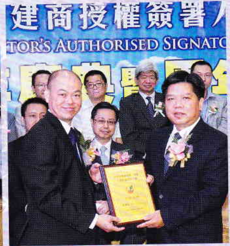
黃醒林主席、胡啟發籌委主席向主禮嘉賓區載佳署長、林琨琅副處長、謝錦文部長致送紀念牌