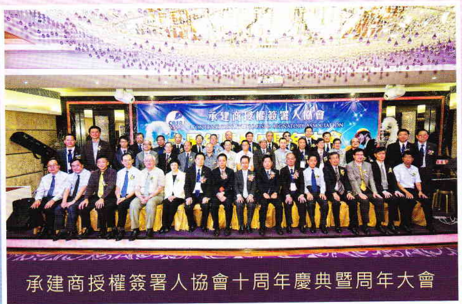
承建商授權簽署人協會十周年慶典暨周年大會

本協會創辦十年，榮幸相關政府部門、業界友會以及本會會員的支持。是晚邀得來自政府和友會的30多位代表蒞臨，集會員和業界友人，筵開32席。感謝各位的光臨。