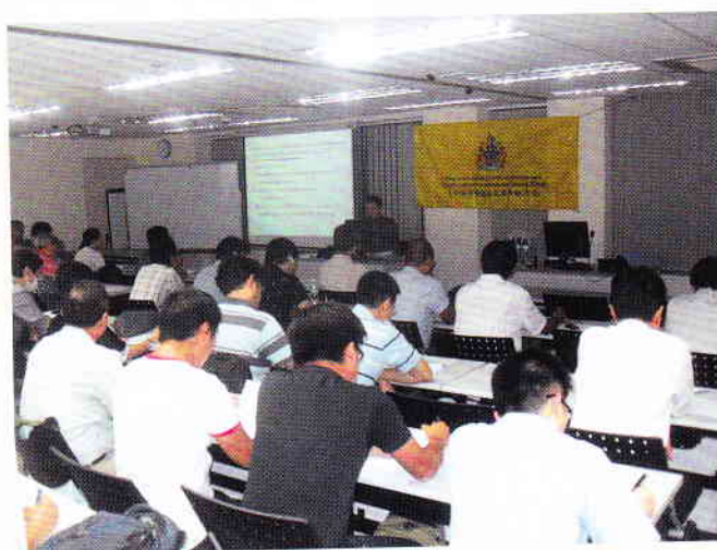
本會會員踴躍參加是次介紹，圖為上課現場

本會受工程監督及建設監理學會(香港)之邀請，成為“挖掘准許證管理系統介紹”的支持機構之一，本會會員享受優惠條件參加是次研討會。