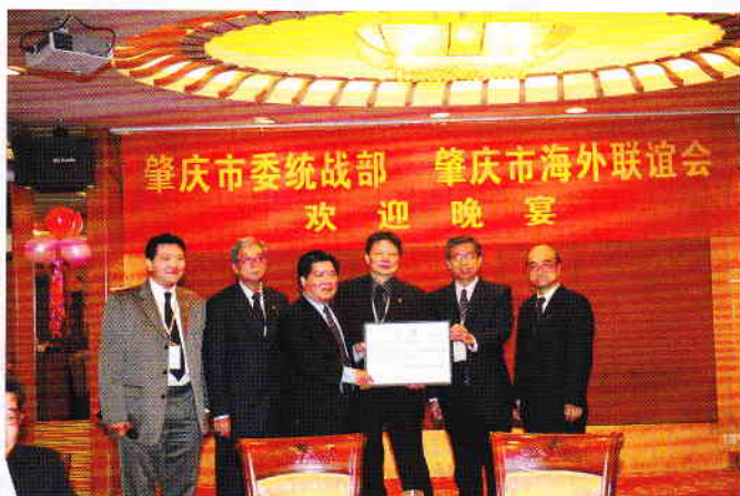
5/12/2009 本會把籌得的3萬元人民幣捐贈給肇慶市委統戰部用於四川賑災項目