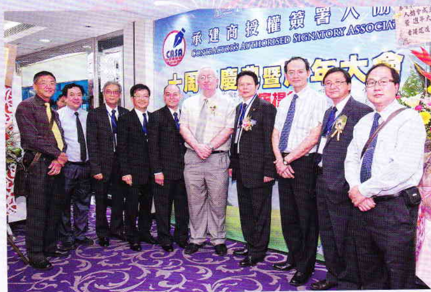
委員與香港理工大學蒞臨嘉賓合照