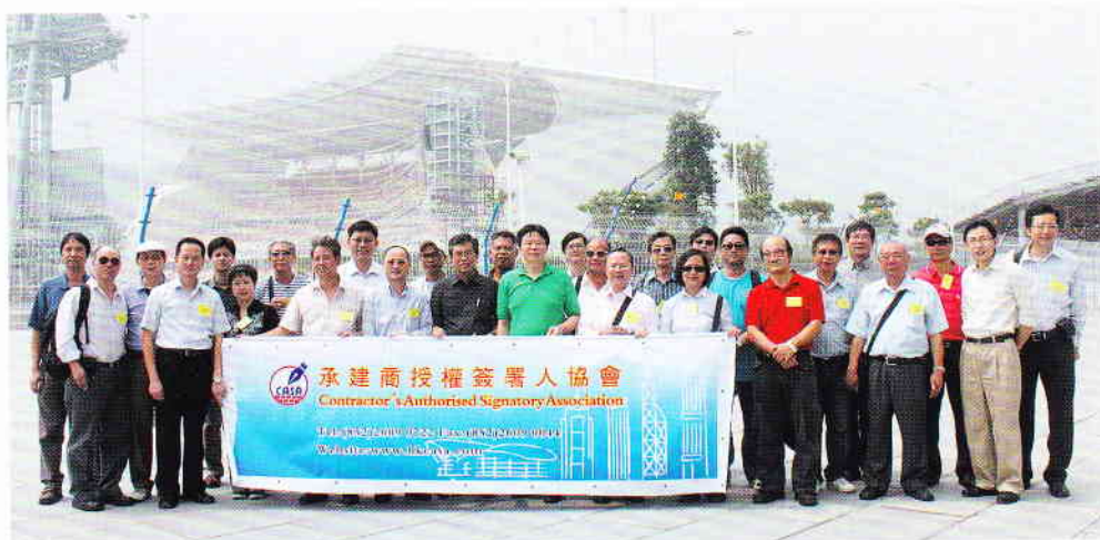
團友在亞運開幕場館前的中軸線廣場留影