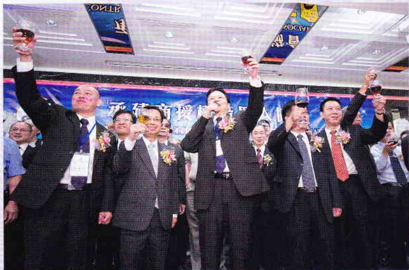
委員嘉賓上臺祝酒