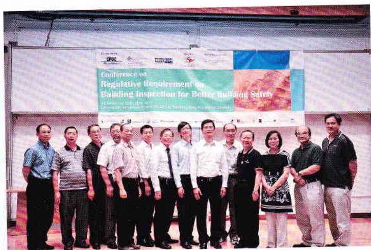
部分參加研討會的本會會員合照

本會受建造及工程專業發展中心之邀請，成為“樓宇檢測研討會”的支持機構之一，本會會員享受優惠條件參加是次研討會。