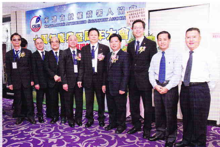
委員與廣東肇慶市委統戰部蒞臨嘉賓合照