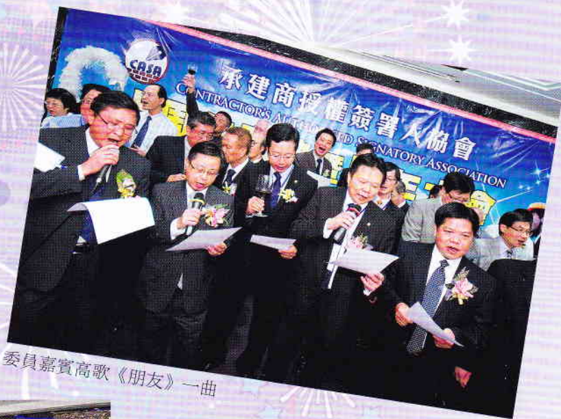
委員嘉賓高歌《朋友》一曲