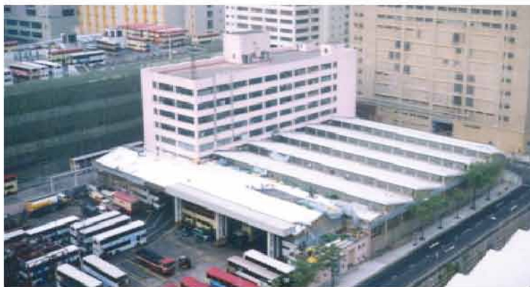
更換屋宇天面坑片及防水