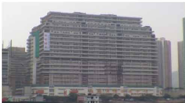
緊急屋宇結構鞏固