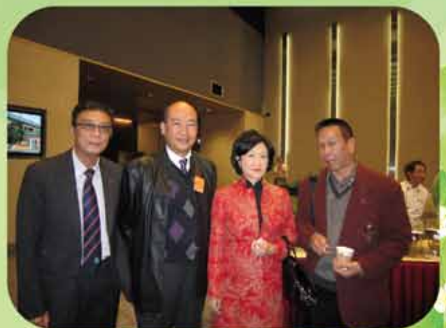
(左至右) 陳萬庭/李啟元/葉劉淑儀/黃永華